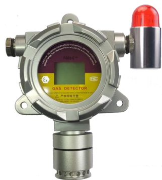
声光报警气体检测仪