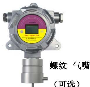
管道连接气体检测仪