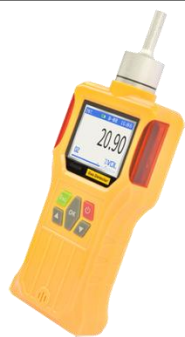
便携式气体检测仪