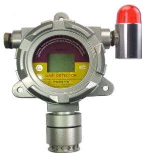
在线式气体检测仪